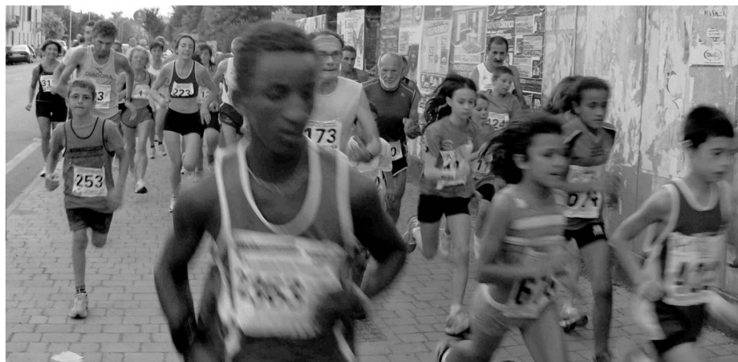
La partenza a Piadana