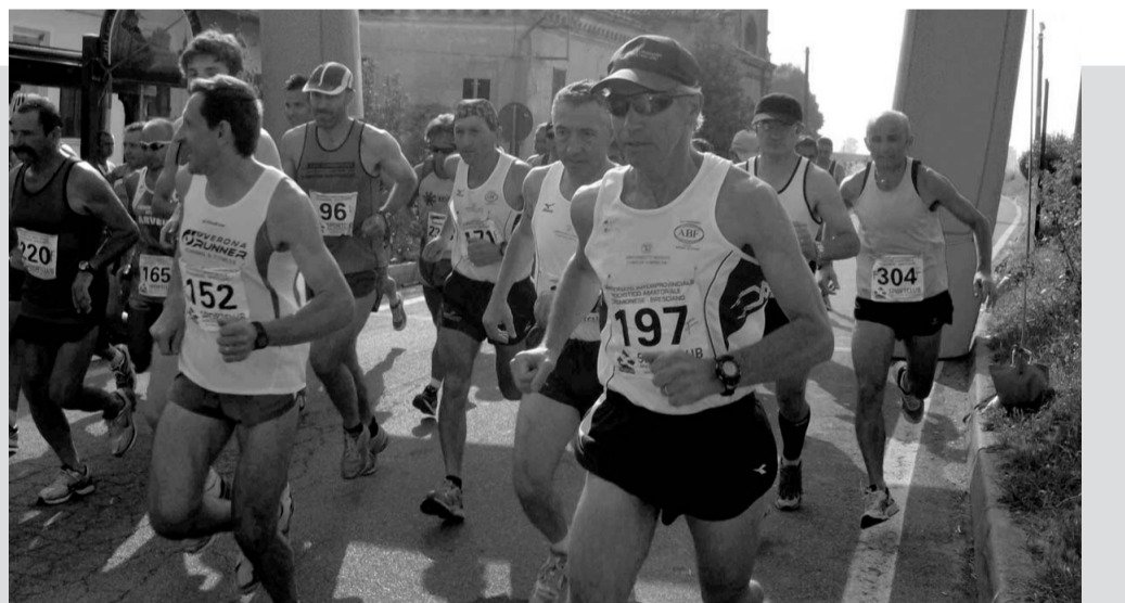
La partenza a Solarolo Monasterolo