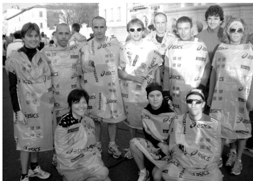
Nelle foto, alcuni scatti della Firenze Marathon