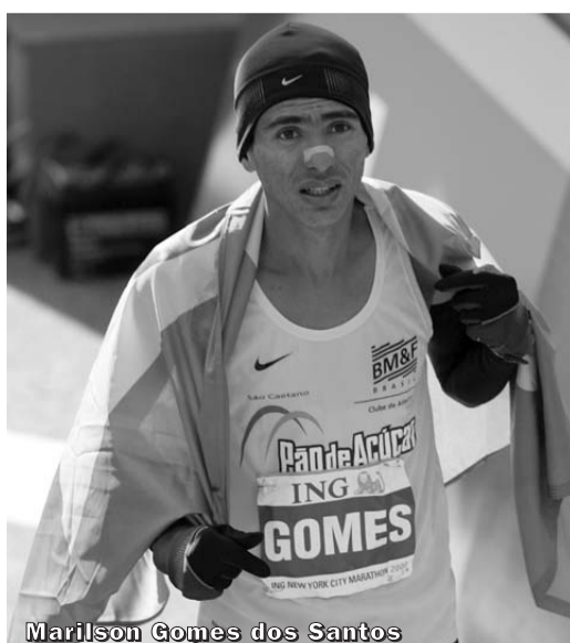
Marilson Gomes dos Santos