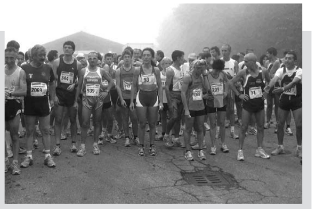
Sopra, la partenza a Bonemerse