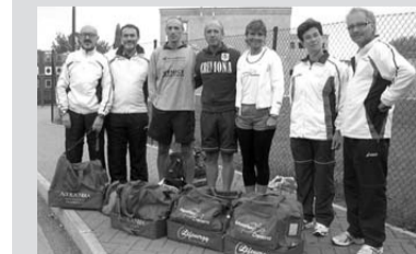
Sopra, una foto di gruppo a Carpi