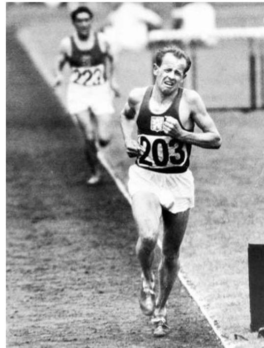
Qui sopra a sinistra l'americano Steve Prefontaine e a destra il cecoslovacco Emil Zápotek

le ultramaratone, considerando l'incoraggiante esordio nella 24 Ore di Golfe-Juan in Francia, con ben 180.250 chilometri percorsi senza sosta.