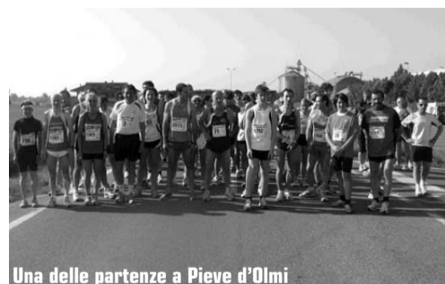
Una delle partenze a Pieve d'Olmi

Hanno goduto di una bella giornata di sole primaverile i podisti che domenica tre maggio si sono trovati a Pieve d'Olmi per la 2° edizione del Trofeo Comune di Pieve d'Olmi, organizzato dai gruppi di Volontariato Olmesi col supporto del comitato podistico Cremonese-Bresciano. Il ritrovo è avvenuto alle