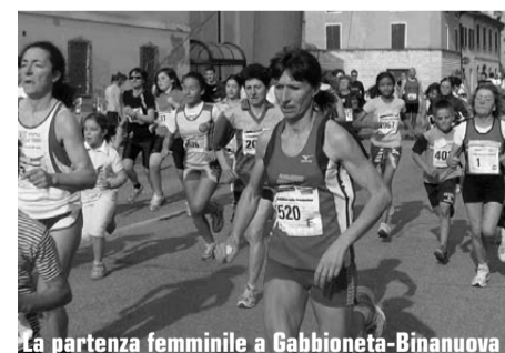
La partenza femminile a Gabbioneta-Binanuova

Si è corso in una serena mattina primaverile il 19° Trofeo Comune di Gabbioneta-Binanuova, valido anche come 13° Trofeo Binex. Gli appassionati che hanno raccolto l'invito degli organizzatori, il "Gruppo Insieme" Binanuova, si sono radunati dalle ore 8. I primi a correre sono stati i più piccoli della categoria Pulcini, a seguire sono partite le donne e la categoria B maschile, infine gli uomini. I tre percorsi stabiliti dagli organizzatori hanno subito delle modifiche a causa del livello alto del fiume Oglio. Ad allietare la festa dei corridori hanno contribuito un ricco ristoro e le premiazioni che hanno riguardato diversi atleti delle varie categorie sia maschili sia femminili. Per il primo e la prima classificati in assoluto è stato dato anche un buono valore di 50 euro, e premi a tutti i gruppi con un numero di iscritti superiore a 10. La prova è stata valida per il Gran Prix. Classifiche maschili: categoria A