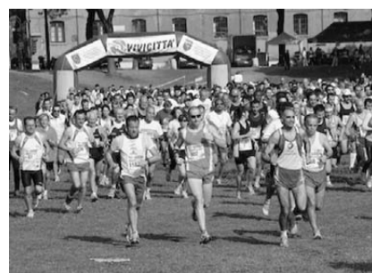
Sopra, una recente Vivicità

Domenica 26 aprile si correrà il "Vivicità 2009", giunto alla sua nona edizione. La manifestazione vedrà la possibilità di scegliere tra la gara competitiva, sulla distanza di 12 chilometri, e quella amatoriale di 6 chilometri, inoltre i pulcini potranno gareggiare su un percorso, a loro riservato, di un chilometro. La corsa sarà l'occasione per una raccolta fondi in favore delle associazioni "Medea" e "Futura". Il ritrovo è alle ore otto e trenta al Palazzo Cittanova in corso Garibaldi, la partenza avverrà alle ore dieci e trenta. Per la gara competitiva saranno premiati i primi otto uomini e le prime cinque donne, per quella amatoriale premi individuali in base alla categoria d'appartenenza e premi ai gruppi più numerosi.