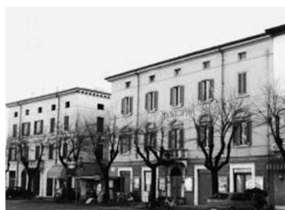
Sopra, una veduta di Carpenedolo

Si correrà sabato 25 aprile, festa della Liberazione, il 25º giro di S. Gottardo. La manifestazione è organizzata dal gruppo Atletica Carpenedolo, la corsa è aperta a tutti. Ci sono quattro percorsi previsti da affrontare in base alla categoria d'appartenenza: 600 metri per i pulcini, 1,2 chilometri per i bambini, 2,5 chilometri per i giovani ed infine 9 chilometri per gli adulti. Verranno premiati i gruppi con minimo dieci iscritti, i primi classificati delle categorie Fidal maschile e femminile ed i primi classificati secondo il regolamento del Hinterland Gardesano. Il ritrovo è fissato alle nove presso il parcheggio dello stadio "Mundial '82" a Carpenedolo, la partenza è prevista alle ore nove; ci sarà il servizio di ristoro all'arrivo ed a metà tragitto.