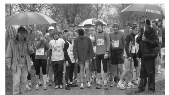
Sopra, la partenza dei giovani a Soresina